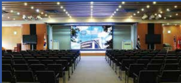
멀티미디어 컨퍼런스 룸

학습형 기숙사로서 외국어(영어공용)만 사용하며 원어민 교수가 기숙 지도교수로, 외국인 유학생들이 멘토로 활동하여 상호간의 튜터링 시스템을 활성화하고 있습니다.