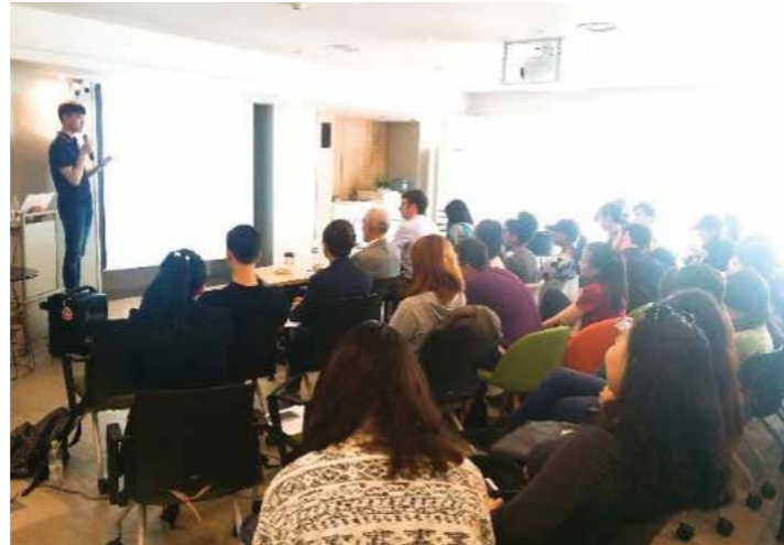
SolBridge Startup Idea Competition 결선 (2018. 4) 우승자는 여름학기 중 미국 Babson College 에서 2주간 글로벌 프로그램 참여 및 학점 취득 가능