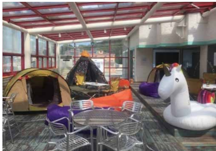
3 Day Startup Regular Program 한국 최초 개최 (2017. 9) 세계에서 가장 유명한 대학생 대상 집중 창업 교육 프로그램인 3 Day Startup 을 충남대학교와 협력하여 진행 2박 3일간 해커톤 및 강의를 결합된 방식으로 창업의 기초를 직접 경험