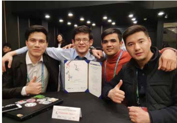
아시아 최대 규모 대학생 창업경진대회인 제17회 ASVF (Asian Students Venture Forum) 본선에 3팀 진출 및 3등상 수상 (2018. 3)